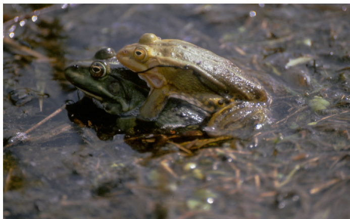
Poelkikermannetje (boven) in paarhouding met Middelste groene kikker.