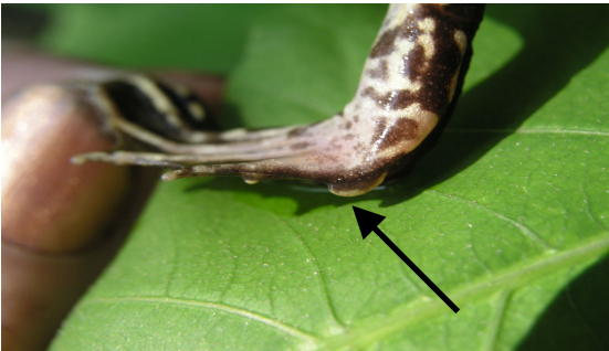
Middelste groene kikker (MGK): middelgrote/variabele metatarsusknobbel, meestal asymmetrisch met hoogste punt naar de teen toe. Hoogste punt altijd lager dan helft van de lengte. (foto Annemarie van Diepenbeek).