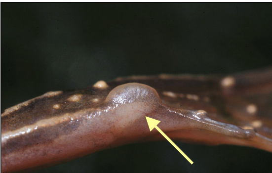
Poelkikker (KGK): naar verhouding grote metatarsusknobbel, half-cirkelvormig en symmetrisch.